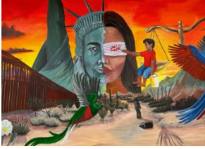
Instituto Nacional de Migración, Grupos Beta, C. Reforma 465, Col del Rosario, 84020 Heroica Nogales, Sonora, 2023