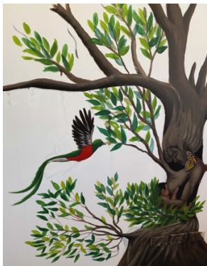
Kino Border Initiative, Nogales, Sonora, 2022