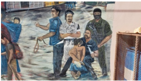
CAME Centro de Atención al Migrante Exodus, Agua Prieta, Sonora, 2022