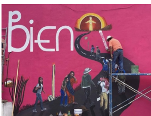
CAME Centro de Atención al Migrante Exodus, Agua Prieta, Sonora, 2022