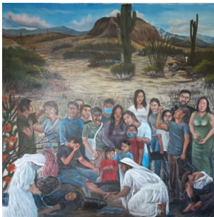
CAME Centro de Atención al Migrante Exodus, Agua Prieta, Sonora, 2022